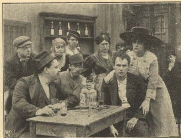
Tilbage paa Lastens Vej.

En Dag, da Owen og hans Kone spadserer en Tur i Parken, faar Owen pludselig Solstik og maa køres hjem, stærkt lidende; og fra den Dag svigter Owens Hukommelse ham fuldstændig. Han kan slet intet huske og lider stadig