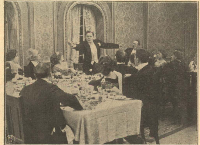
Vanviddet bryder atter ud.

Ude af sig selv af Sorg søger Annie overalt efter ham og finder ham langt om længe i en obscur Knejspe, men han kendes ikke mere ved hende, — Sygdommen har fuldstændig lammet hans Hukommelse.