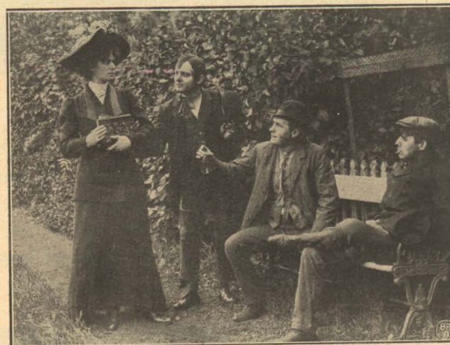
Vagabonderne forulemper de Forbipasserende.

Owen tilbyder galant at følge hende hjem, og Annie Bell, der er ganske betaget af Owens brutale Skønhed, giver ham villig Lov dertil.