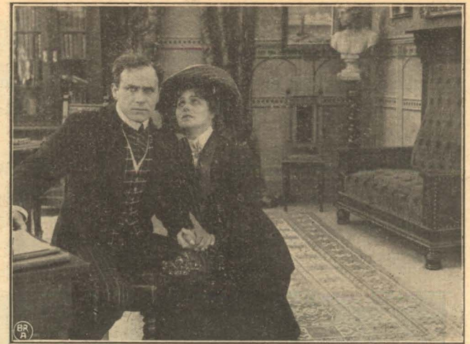
Nej — han husker hende ikke!